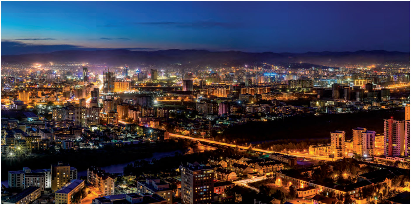
Ulaanbaatar – die Hauptstadt der Mongolei bei Nacht

W ährend des Landeanfluges fragt mich meine Sitznachbarin „Ist das dein erster Besuch in der Mongolei?“ Immer wieder haben wir uns während des Fluges angelächelt. Sie hat die natürliche Schönheit der Nomadenvölker, ihr Englisch klingt vorsichtig und fremd. „Ja“, erwidere ich und schenke ihr ein Lächeln, „seit Jahren wollte ich schon in die Mongolei kommen, jetzt ist es endlich so weit.“ „Du wirst mein Land lieben. Es ist wunderschön.“ Mehr sagt sie nicht. Mehr bedarf es auch nicht.