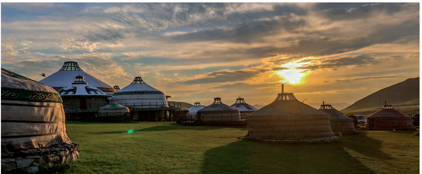
Mongolische Jurten im Sonnenuntergang dienen uns als Basiscamp

Doch so wenig liebevoll dieser erste Blick auf Ulaanbaatar doch ist, so haben wir durch Oyun und unseren freundlichen Taxifahrer (auch wenn dieser kein Wort Englisch spricht) schon einen sehr positiven Eindruck von diesem Land. Das Ba-