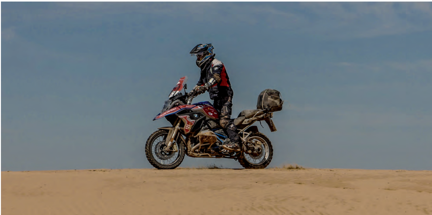
Mit viel Freude wird der sandige Wüstenboden durchgraben

siscamp liegt vor den Toren Ulaanbaatars, inmitten einer sanften Hügelkette, fernab der grauen Stadt. Die traditionellen Ger-Zelte strahlen im warmen Abendlicht mit den perfekt aufgereihten R 1200 GS um die Wette. Was für ein faszinierendes Willkommensbild. Am liebsten würde ich sofort aufsteigen und mit Dschingis Khan ins Abendrot aufbrechen, er auf seinem wilden Gaul, ich auf meiner GS.