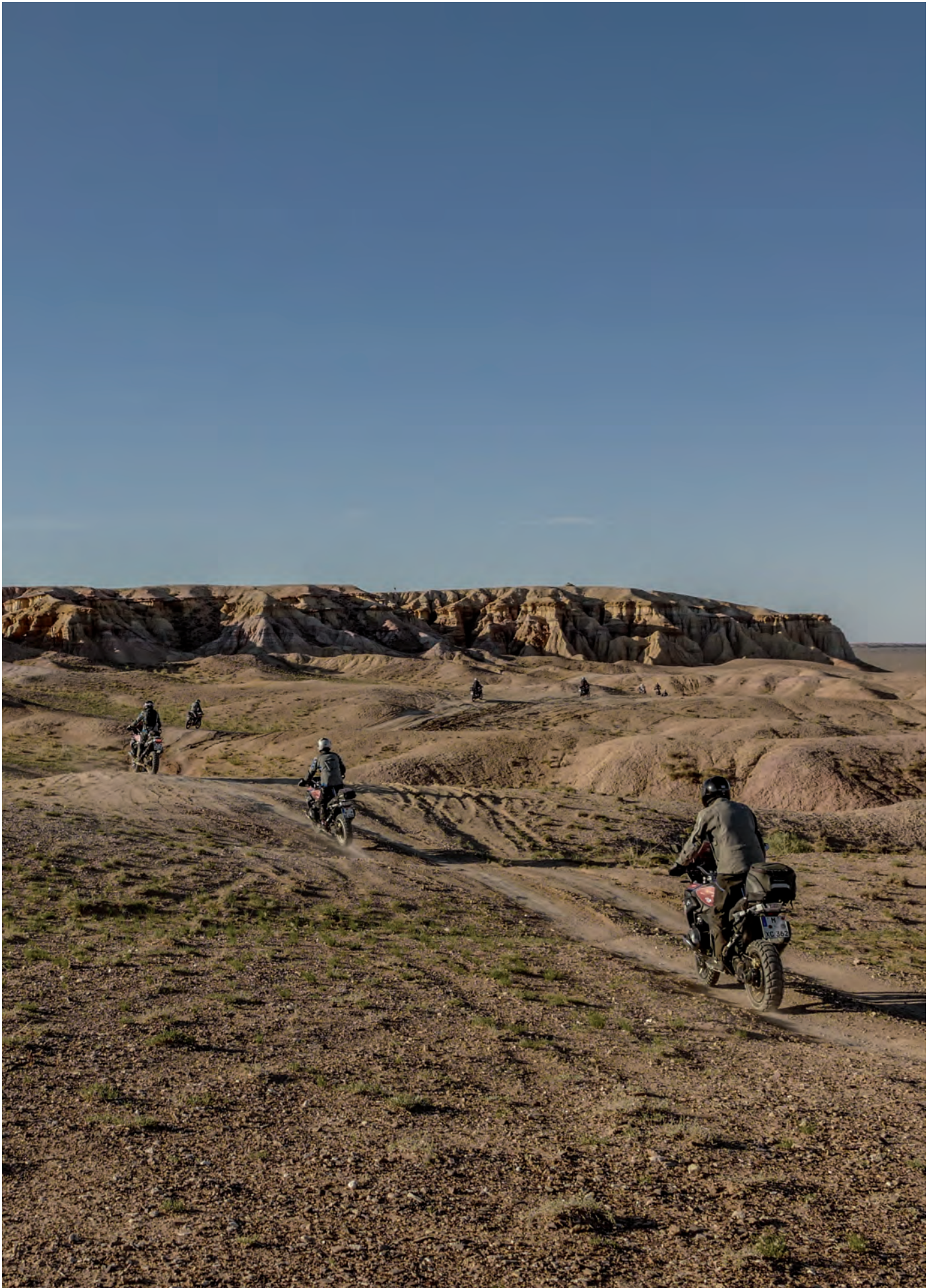
Eine Landschaft, die begeistert