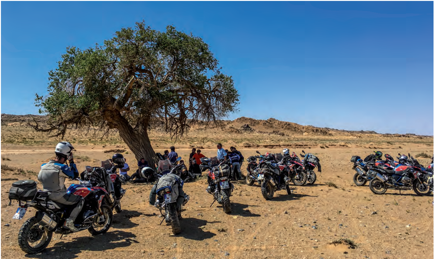
In der prallen Sonne sind Schattenplätze reichlich begehrt

die Metallkante der Badezimmertür. So steht Miles Minuten nach dem Stunt in der Dusche mit den Worten vor uns „Do you wanna hear the good news first or the bad news ... I can ride, but I have a deep, bleeding cut in my lower arm“. Das Ergebnis des Ausrutschers ist eine lange und tiefe Schnittwunde, die im Wüstencamp mit einer Naht versorgt werden muss. Unfall Nummer zwei, total peinlich, weil ich an dieser Stelle zugeben muss, dass ich das Opfer bin: hügelige Region, sandige Strecke durch-