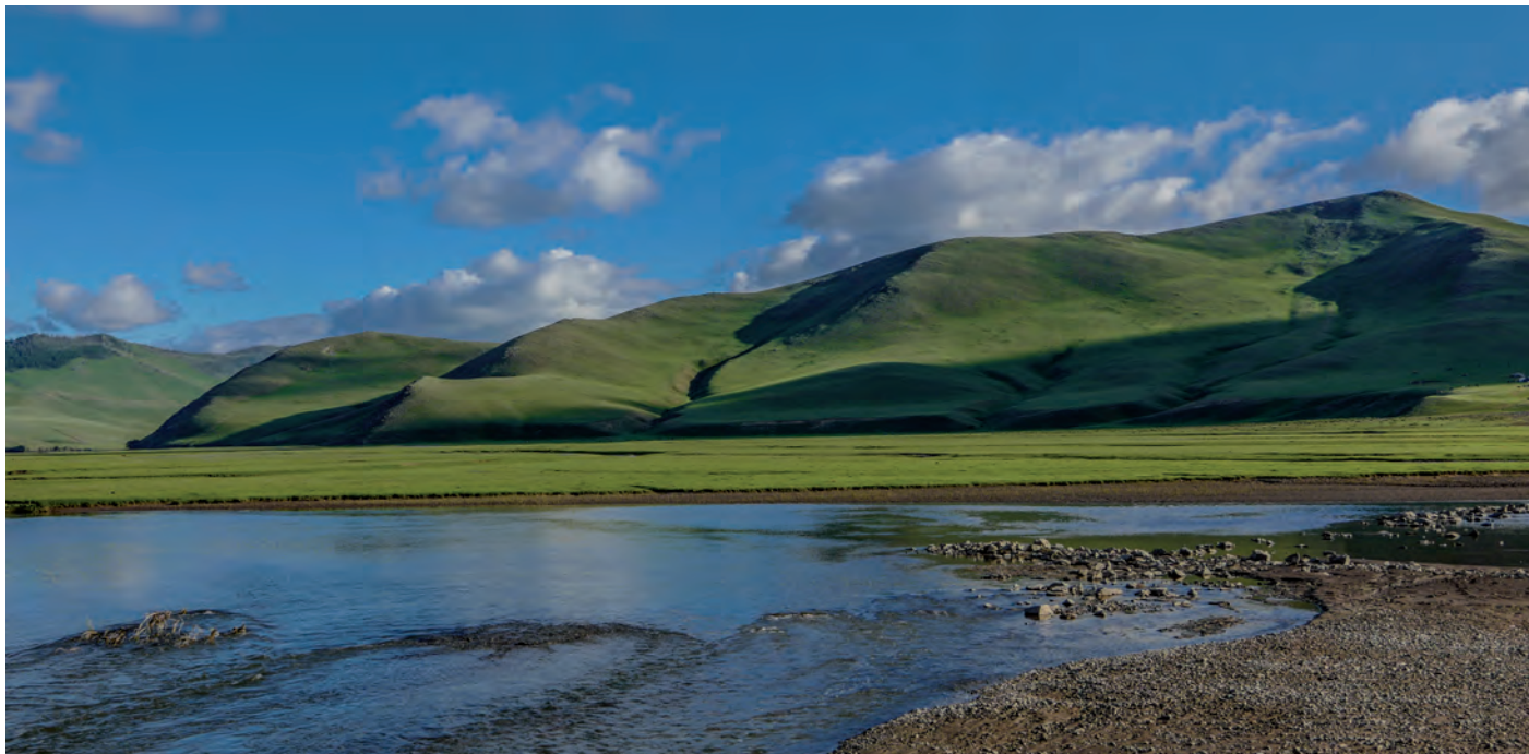
Die scheinbare unendliche Ferne der Landschaft zieht uns in ihren Bann

Am nächsten Morgen geht es endlich los. Unsere ersten Motorradkilometer im Land der Erben Dschingis Khans! Knapp 450 km hält der Tag für uns bereit und eine gute Mischung aus Straße, Schotter und Gelände. Bereits wenige Kilometer ins Landesinnere hinein wird uns klar, was es mit der sagemwobenen Weite der mongolischen Steppe auf sich hat. Das Land ist nicht nur überwältigend schön und überwältigend leer, sondern auch überwältigend groß und weit. Die Schotterpisten erstrecken sich häufig bis tief in den Horizont hinein. Wir sehen nichts als unendliches Grün und spüren die Freiheit der Nomaden, deren traditionelle Ger-Zelte von Zeit zu Zeit das Bild bereichern. Mit einem riesen Lächeln im Gesicht gebe ich Gas, der Hinterreifen schwänzelt voller Begeisterung und der Schotter fliegt nur so dahin – Mongolei, du hast mich schon jetzt in deinem Bann! Nach einem erlebnisrei-