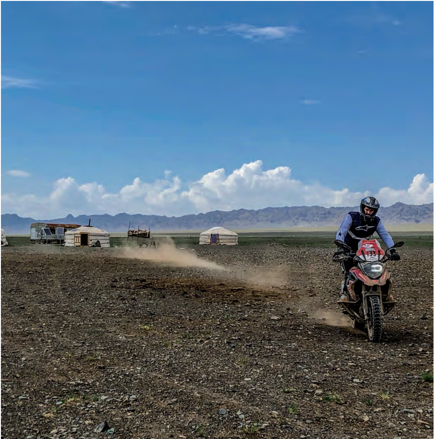
Unsere Motorräder lassen den Staub fliegen

zen und gegenseitig versuchen, die unaussprechbaren Namen auszusprechen. Die genialen Motorradstrecken. Die Sandbetten. Die Schotterpassagen. Die Anstiege. Die Weitblicke. Die Täler. Die Canyons. Die Wüste. Die Sanddünen. Die Flußdurchfahrten. Die Schokoriegel, die uns das mongolische Begleitteam immer wieder zwischendurch anbietet, sowie die tollen Menschen, mit denen wir diese Tage erleben dürfen. Auch wenn es nach wie vor sonderbar ist, inmitten der Mongolei konstant zwischen Bayerisch, Französisch und Englisch hin und her zu wechseln. Aber was tut man nicht alles zur allgemeinen Völkerverständigung.